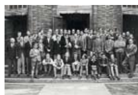
Zeitläufte: Aktuelle Latymer-Internetseite, britische Schüler in Hamburg 1949.