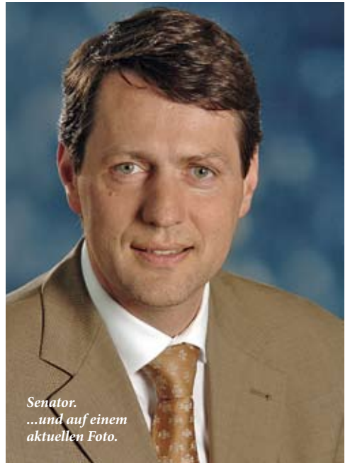
Senator. ...und auf einem aktuellen Foto.