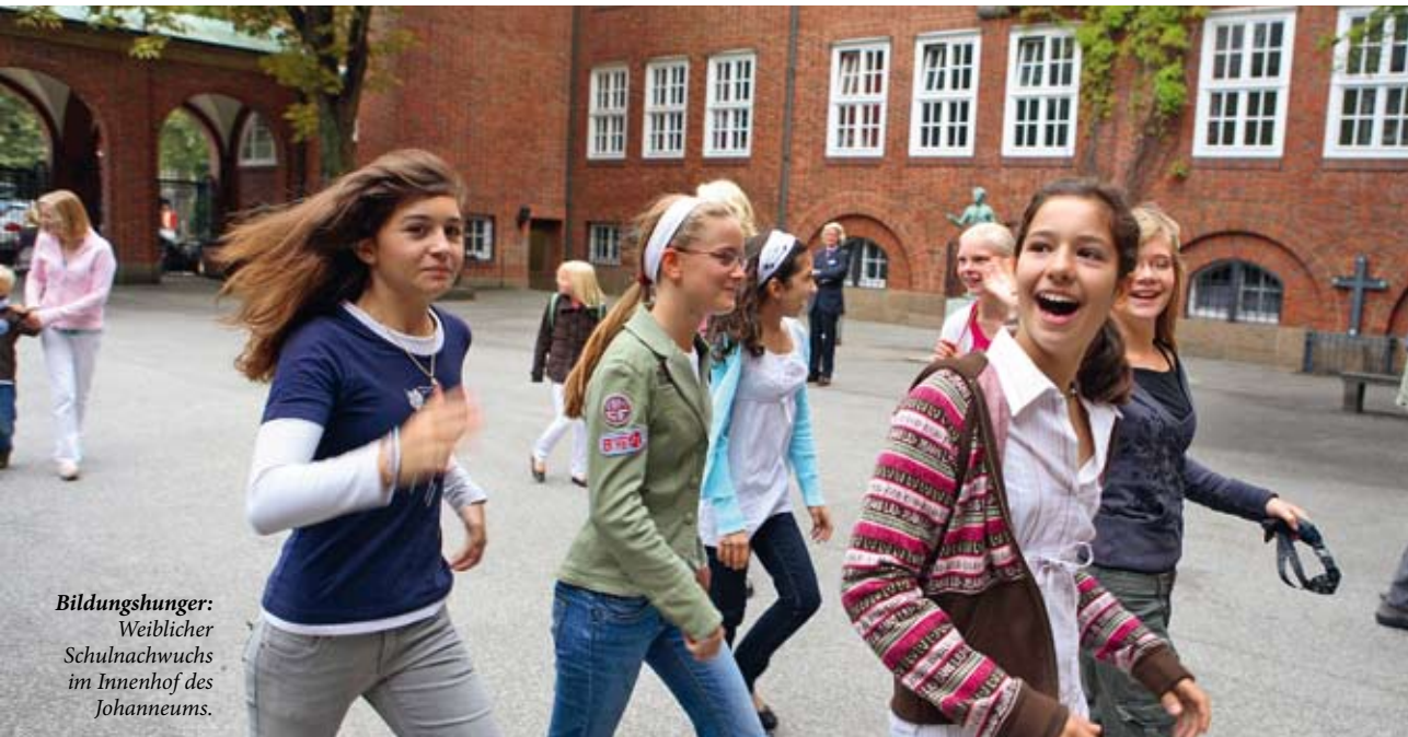
Bildungshunger: Weiblicher Schulnachwuchs im Innenhof des Johanneums.

Vokabelpauken. Unser Curriculum in der Beobachtungsstufe, also in den Jahrgängen 5 und 6, lässt sich nicht auf Lernbucharbeit, Grammatikunterricht und den Einstieg in einfache Lektürestoffe reduzieren. Alle Fächer sind miteinander verzahnt. Es ist dieser ganzheitliche Ansatz, der das humanistische Curriculum ausmacht. Diese Vernetzung entfällt, wenn nicht alle Schüler denselben einheitlichen Bildungsgang durchlaufen.