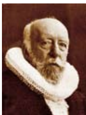
Legende. Johann Georg Mönckeberg war 32 Jahre Senator und mehrfach Bürgermeister.