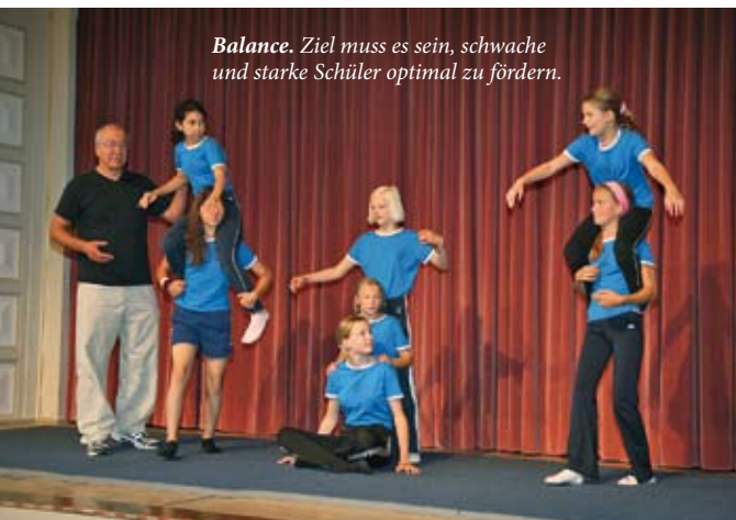
Balance. Ziel muss es sein, schwache und starke Schüler optimal zu fördern.